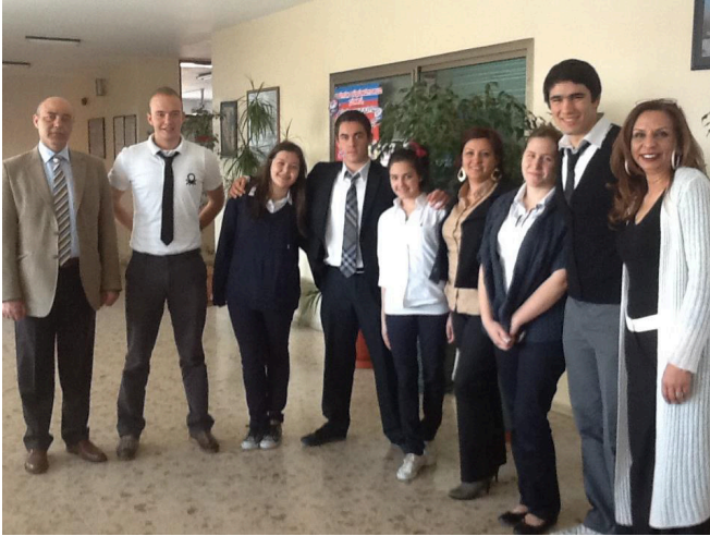
Büyük Kolej'de Münazara

Hem tekniği hem de içeriği ile münazara, öğrencileri çok farklı alanlarda geliştiren, öğrencilerin dünyaya bakış açısını zenginleştiren bir 'spor'. Bu sebeple münazara "Kazananların Spor'u" da deniyor. Münazara yapmaya başlayan öğrencilerin sözcük hâkimiyeti ile ikna becerileri geliyor ve en önemlisi öğrenciler, karşılaştıkları her fikri sorgulayan, eleştirel düşünmeye alışkın bireyler haline geliyor.